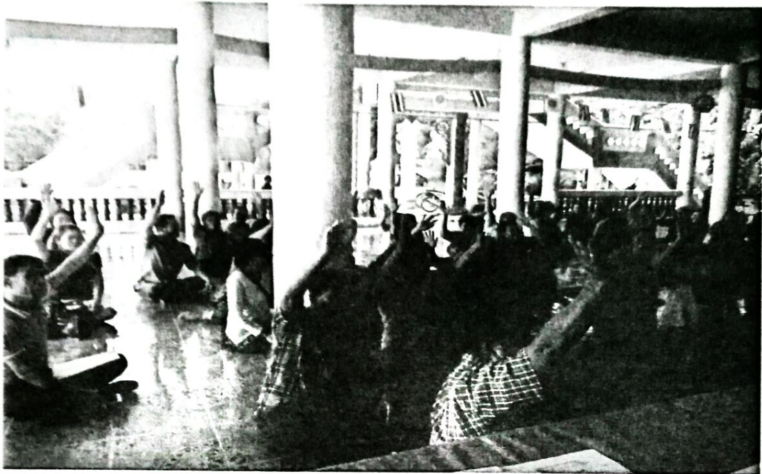
ประชุมประชาคม หมู่ที่ ๙ บ้านนาสามัคคี ณ วัดสร้างแป้นสามัคคีธรรม หมู่ที่ ๙ บ้านนาสามัคคี ตำบลนาเลียง อำเภอนาแก จังหวัดนครพนม